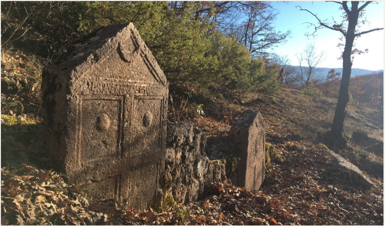
Necropoli di Amplero