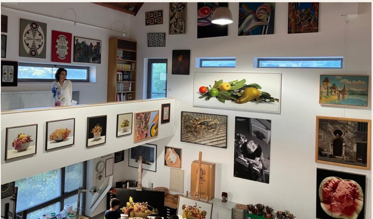
Casa Museo Luciano Ventrone