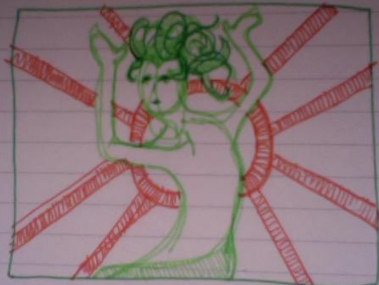
Mezzo busto, la danza a terra dentro al cerchio.