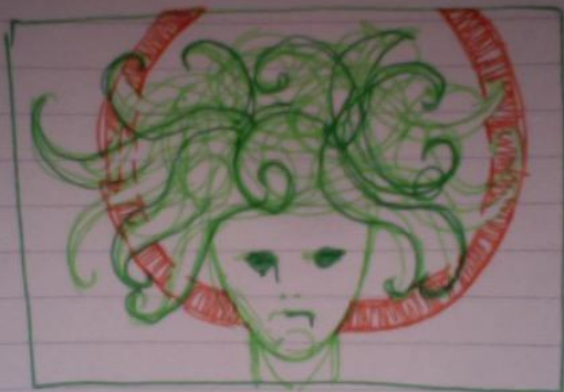
Close up, dettagli viso, capelli al vento, mani e piedi.