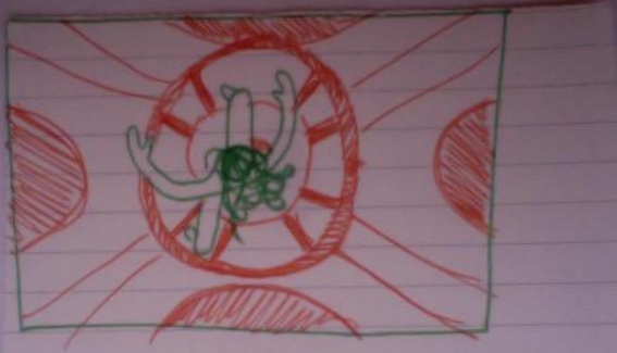
La danzatrice in piedi vista dall'alto, la danza sull'immagine a terra.