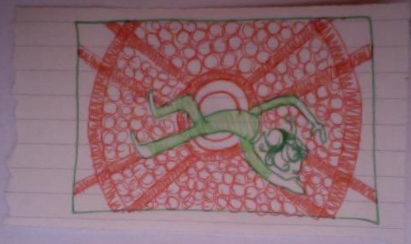
Figura intera, la danza a terra dentro al cerchio.