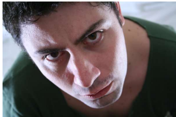
Fabio Paroni - Plato Autore del fumetto originale.